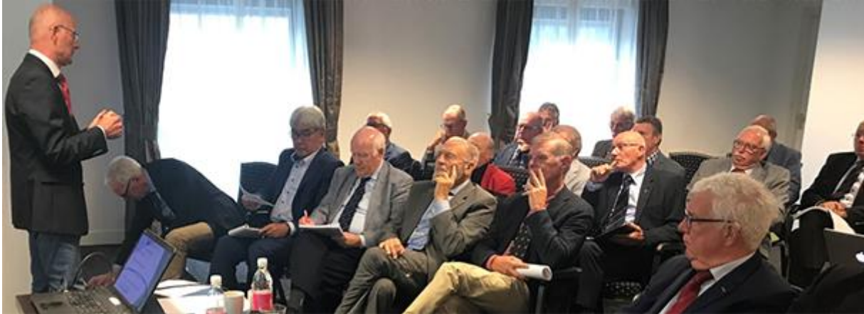
RO-bijeenkomst 2019, heimwee?