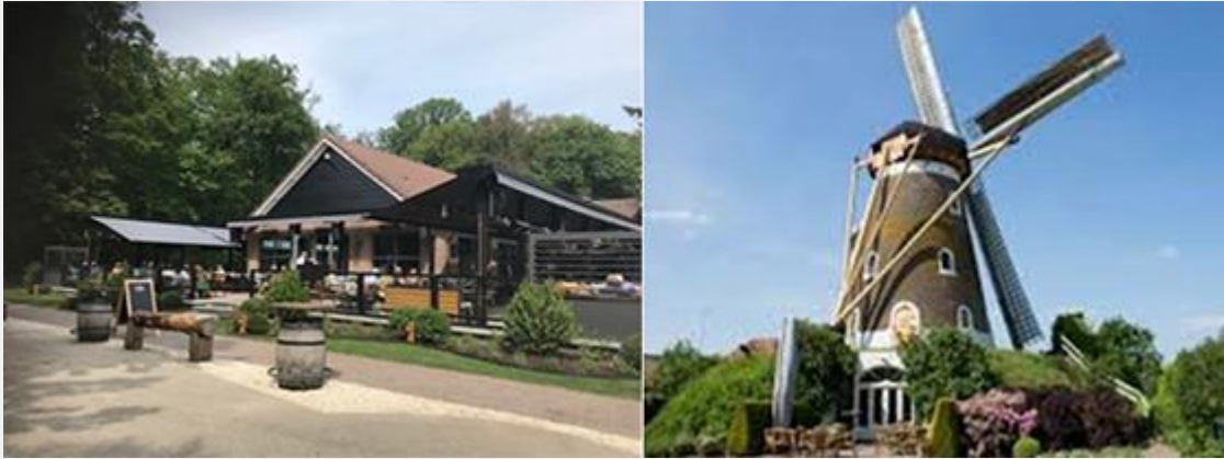
De mogelijke locaties van bijeenkomsten van het Rayon Noord-Brabant West.